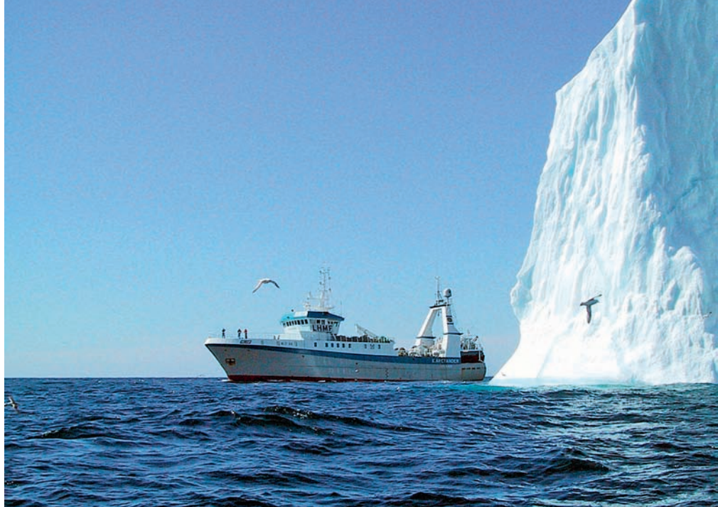
Aker Seafoods disponerer nesten 30 trålkonsesjoner, i løpet av fjoråret samlet på 12 aktive fartøyer. Her er frysetrålere «K Arctander» i nærkontakt med et stort isfjell. Denne båten drives av Nordland Havfiske AS, som ifjor hadde fem stortrålere og omsatte for 263 millioner kroner.

Sammen med datterselskapet Gryllefjord Fryseri AS har Nergård AS 100 prosent eierandel i Ytre Rolløya AS i Harstad. Dette rederiet eier frysetrålere «J. Bergvoll» (57,1 mill. kr.), «Tønsnes» (55,1