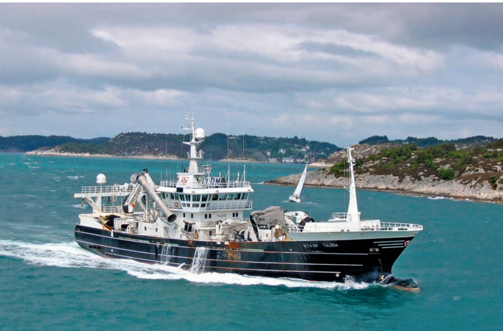
Listen over de 35 største fiskebåtrederiene domineres av selskaper som driver pelagisk fiske. Brødrene Birkeland AS på Storebø i Austevoll kommune, driver to ringnotsnurpere. «Talbor» fisket for 61 millioner kroner i 2008.

eies 100 prosent av de to brødrene gjennom selskapet Teigenes AS. «Sjøbris», som eies av Teigebris KS, har flere eiere. Knut og Sigurd Teige har aksjemajoriteten.